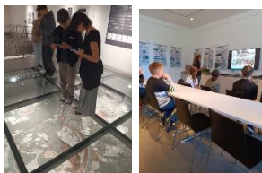
VII. Galambos Tamás Emlékkupa!