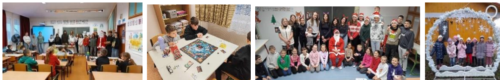
Mikulás kupa 2025