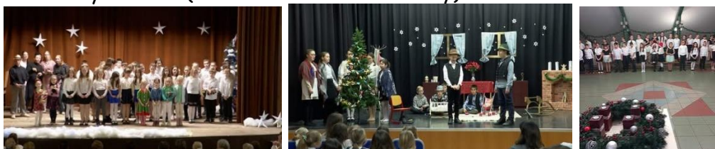
Karácsonyi kiállítás és kézműves foglalkozás